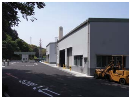
スラグ・ペットボトル棟