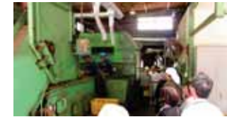
カンライン(職場懇談会)