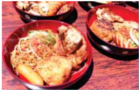
メニューには、焼きそばや焼きおにぎりも、全部で51人前(!)です。