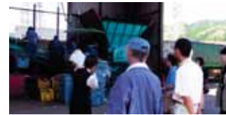
カンの前処理(職場懇談会)