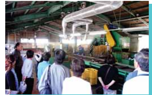
ピンライン。カレット選別(職場懇談会)