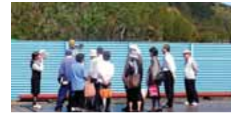
回収されたビン・缶・出荷製品を計量する鉄板にも乗ってみました(職場懇談会)