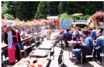
日差しが強くて、少し眩しそうです。