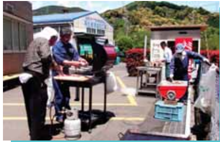
お肉を焼き始めると、良いにおいがしてきます。